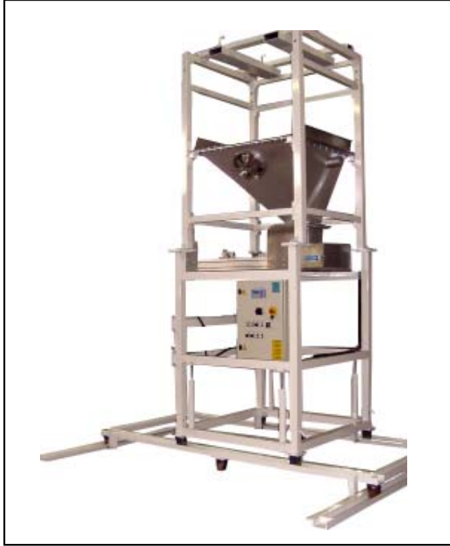
Svuota big bag con nastro estrattore. Big Bag weight discharger with belt