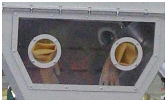
Finestra con guanti Window with gloves