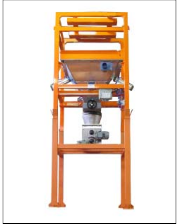
Svuota big bag con dosatore a coclea Big Bag weight discharger with screw loss batcher