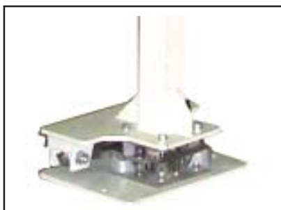
Dettaglio del vincolo e della cella di carico.

La stazione può essere personalizzata con diversi dispositivi quali, pesatura elettronica e controllo del dosaggio del materiale; scuotimento elettropneumatico di saccone e funghi vibranti in caso di polveri poco scorrevoli; sistema di richiusura del saccone non completamente vuotato, ecc..