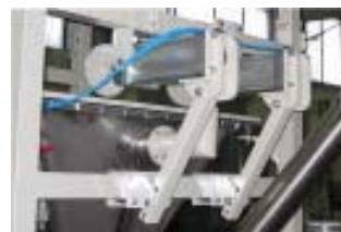
Massaggiatori big bag Big Bag masseur