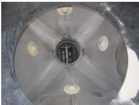
Funghi vibranti Fluidising flow aids